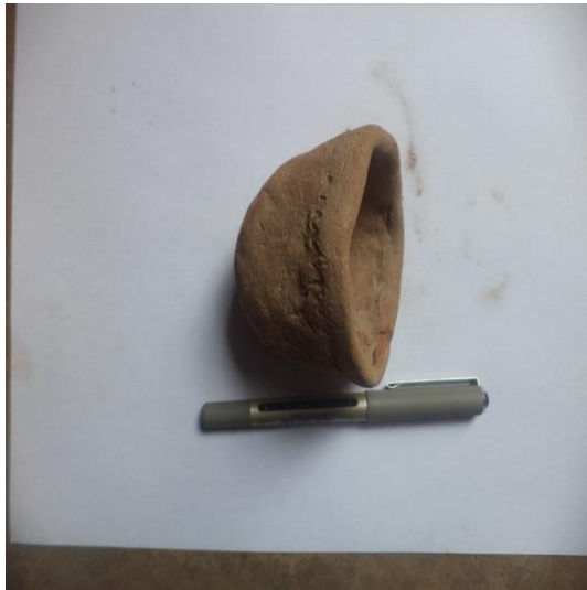
آنية من الطين المحروق