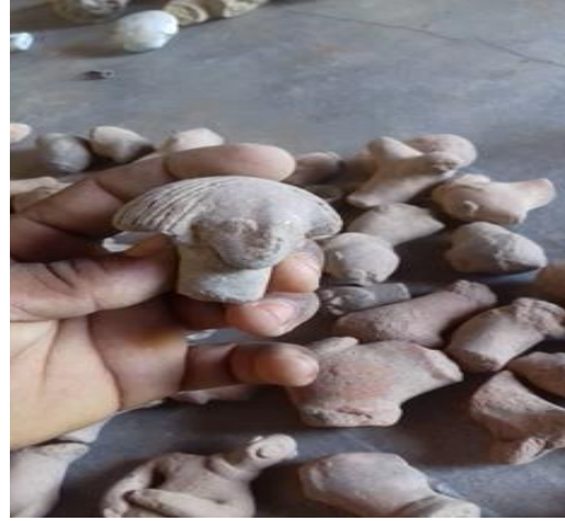
رأس دمية طينية ذات شعر مصفف إلى الوراء