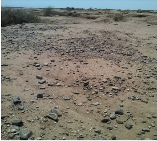
انتشار الحصى المختلف الأحجام على السطح.