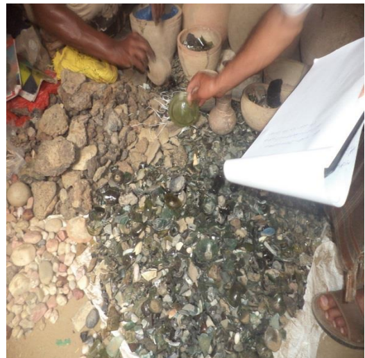
كسر من الزجاج الملون