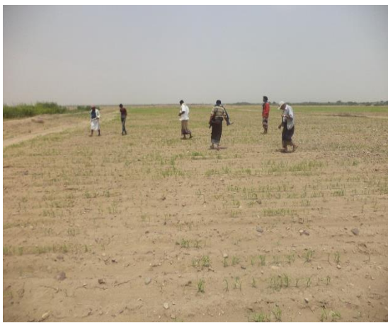
الموقع ٣ بعد تدميره وتحويله إلى أراض وحقول زراعية