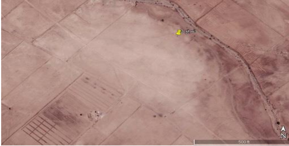
صورة فضائية للموقع (٣) الأثري، يظهر الشكل البيضاوي للتلال الأثري باللون المائل إلى الأبيض بشكل مغاير عن لون بقية التربة المحيطة بالموقع.