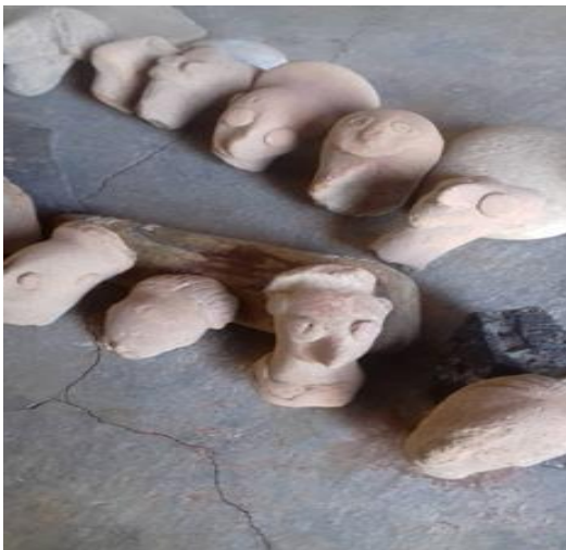
مجموعة من رؤوس دمى طينية