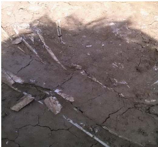
بقايا عظمية هشّة ومتآكلة تكتشف على سطح الموقع