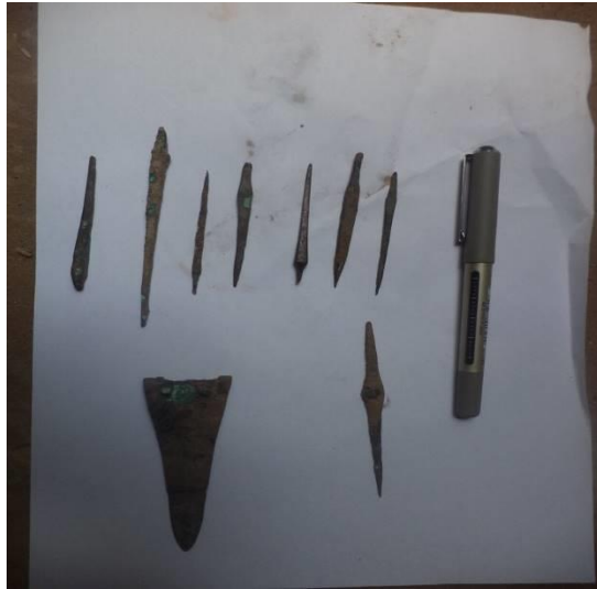
امبال ومخازق من البرونز ورأس سهم من البرونز