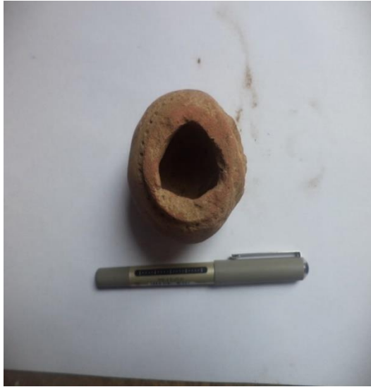
كوب صغير من الطين المحروق بحالة جيدة