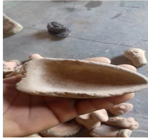
مسرجة حجرية