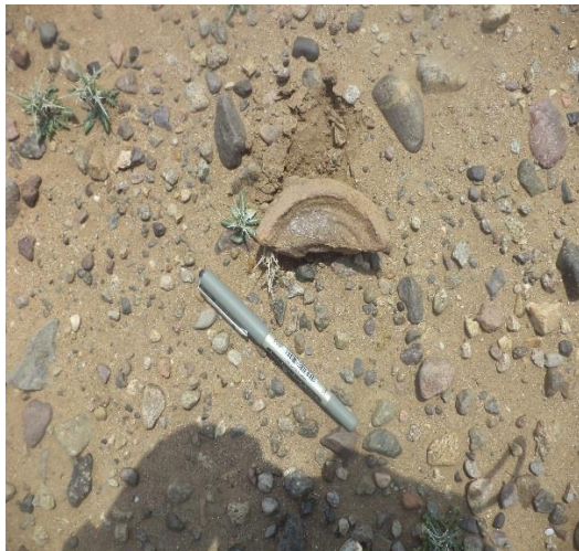
جزء مكسور من قاعدة اناء فخاري