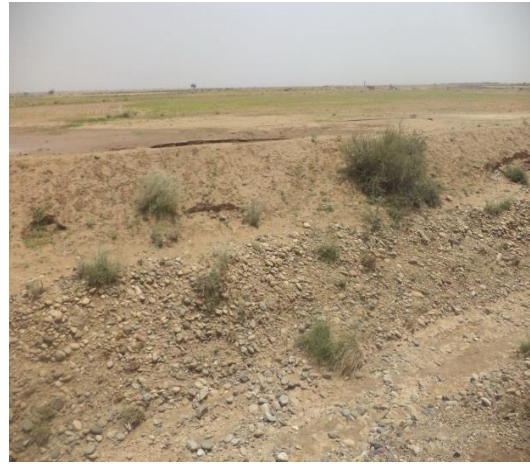
انتشار الحصى الكروي الشكل في المنطقة بكثرة.