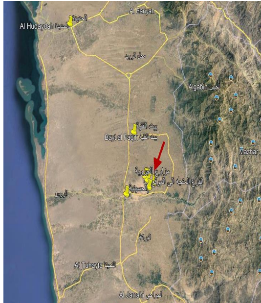
موقع قصر بني معروف إلى الجنوب الشرقي من بيت الغقيه والشمال الشرقي من مدينة الحسينية (المصدر: Google Earth 2022).