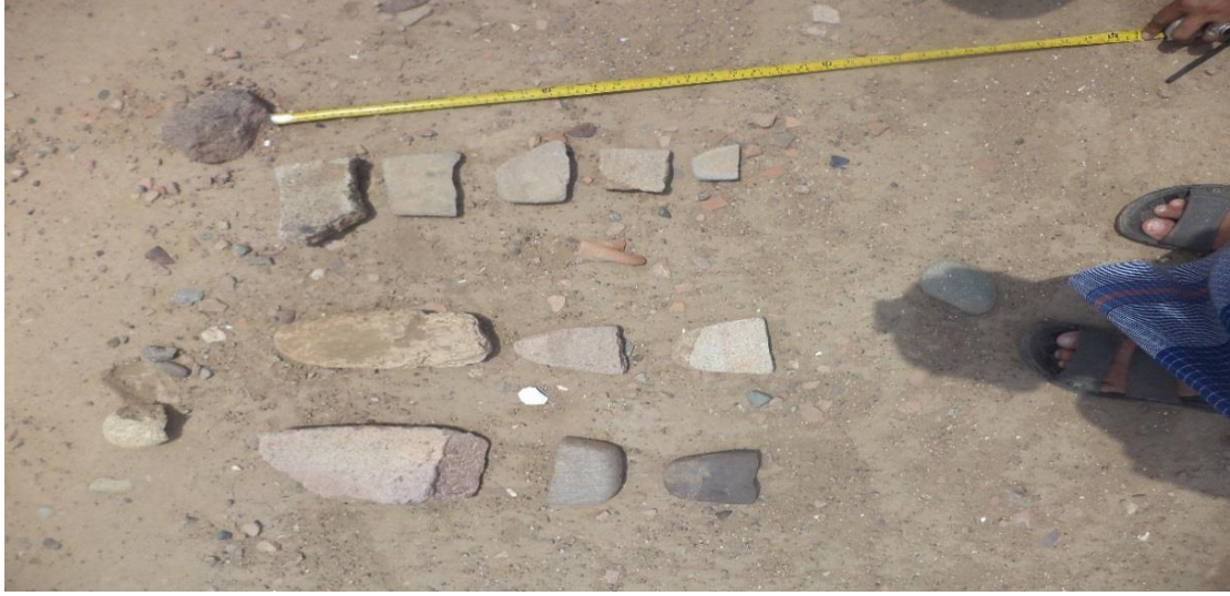
مجموعة من كسر لمساحق ومطاحن حجرية