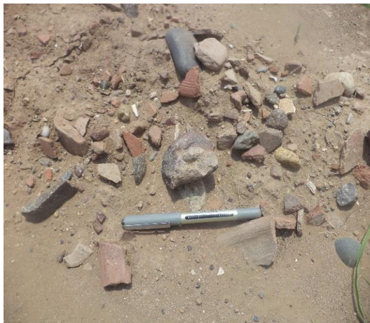
تنوع الكسر الفخارية المنتشرة على جوانب اتلام الحقل الزراعي المستحدث مؤخرا