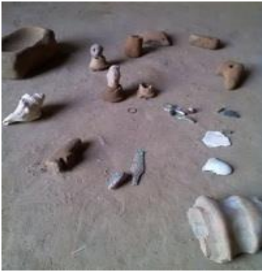
مجموعة من الدمى الطينية (المصدر: حسين زيد معروف)