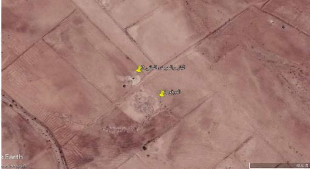
صورة فضائية للموقع (٤) المقبرة وإلى جانبها موقع استحداث بئر وحوض مائي للسقي الحقول الزراعية المجاورة