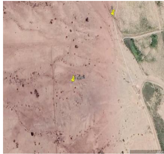
الموقع (١) غرب مزارع الجروية