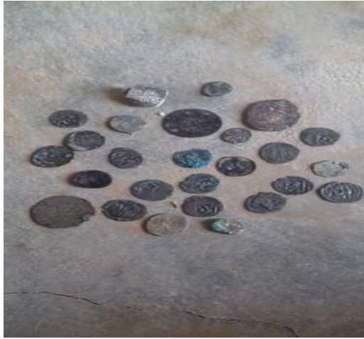
مجموعة من العملات البرونزية