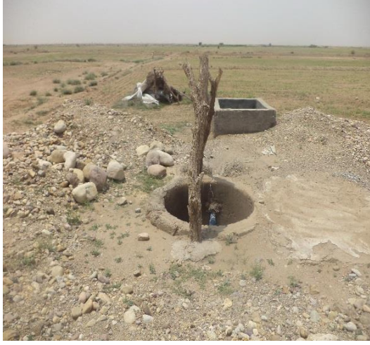
صورة للبئر والحوض المائي المستحدث بالقرب من المقبرة الموقع ٤