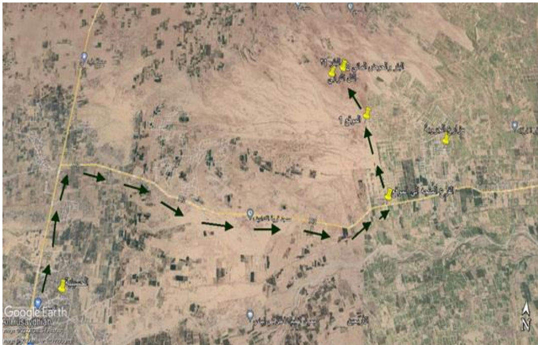
مسار الوصول إلى قصر بني معروف شمال شرق الحسينية وغرب مزارع الجروبة.