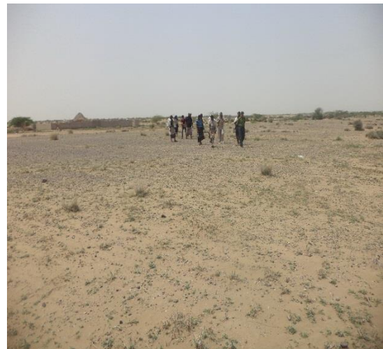
الفريق والحماية الأمنية اثناء تنفيذ المسح الاثري للموقع