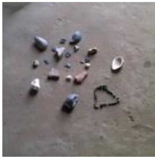
مجموعة من الخرز والاصداق