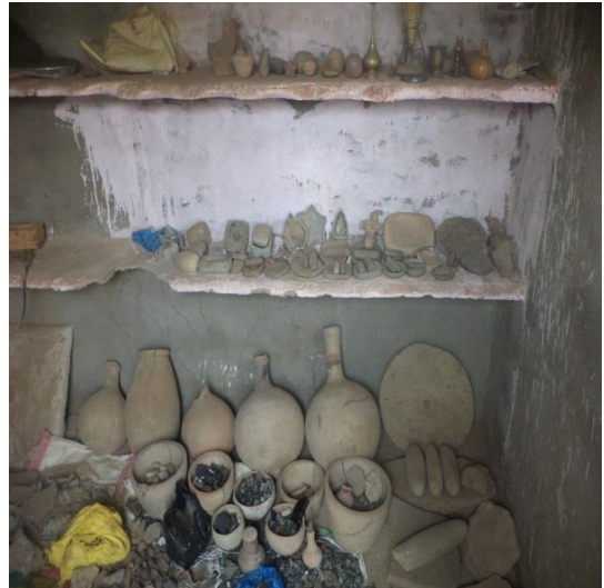
مجموعة من الجرار والأواني الفخارية السليمة