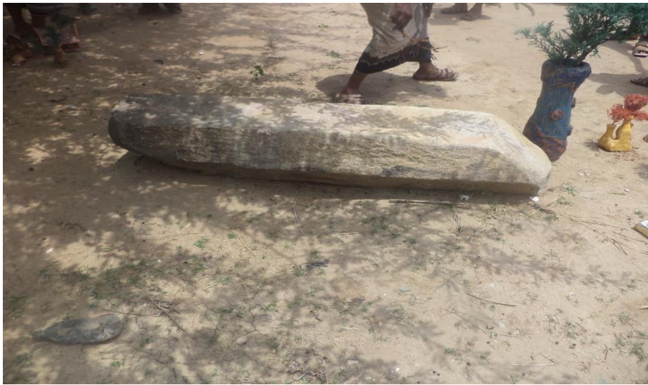
عمود من حجر الجرانيت سداسي الأوجه تم العثور عليه في منطقة القصرة