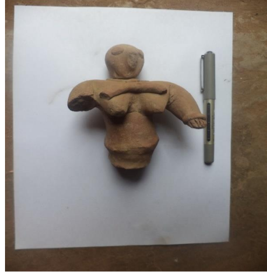
دمية من الطين المحروق لامرأة ذات اثناء بارزة للأمام