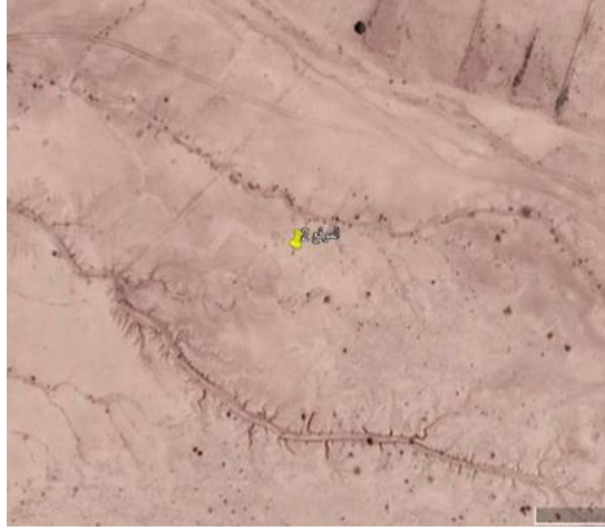
صورة فضائية للموقع ٢ انتشار كثيف للكسر والشقف الفخارية على سطح الموقع ٢