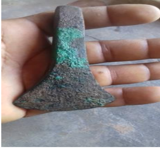
رأس فأس من البرونز