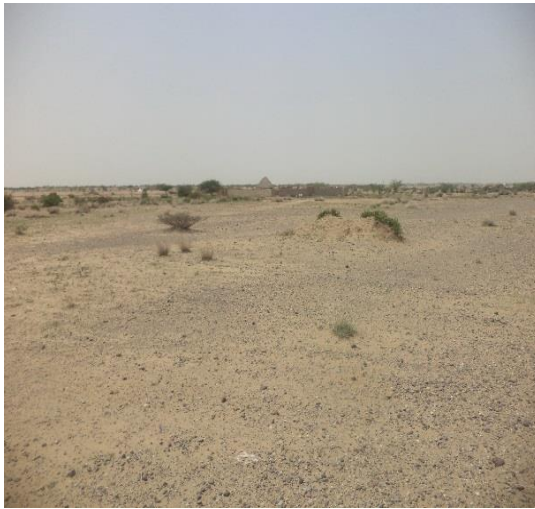
صورة عامة للموقع (١) (الصورة باتجاه الجنوب)