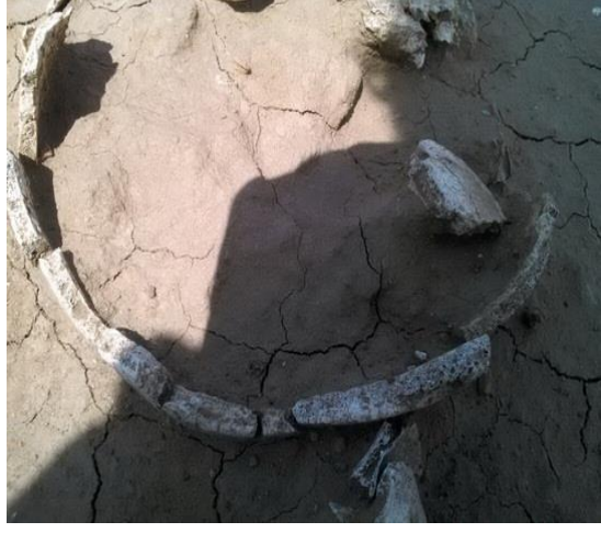
بقايا عظمية هشة ومتآكلة