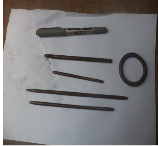
مجموعة من الأميال من البرونز