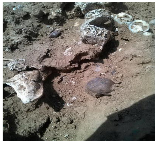
بقايا عظمية تكتشف على سطح الموقع (٤)