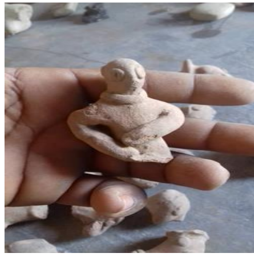
الجزء العلوي من دمية طينية لإنسان