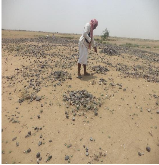
صورة لأكوام الحصى والاحجار على سطح الموقع ٤