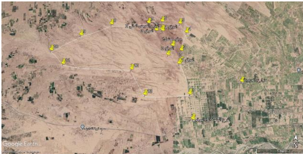
صورة فضائية توضح المواقع الأثرية في قصرة بني معروف والمنطقة المحيطة بها كحماى يمنع الاستملاك أو التأجير أو الانتفاع بها