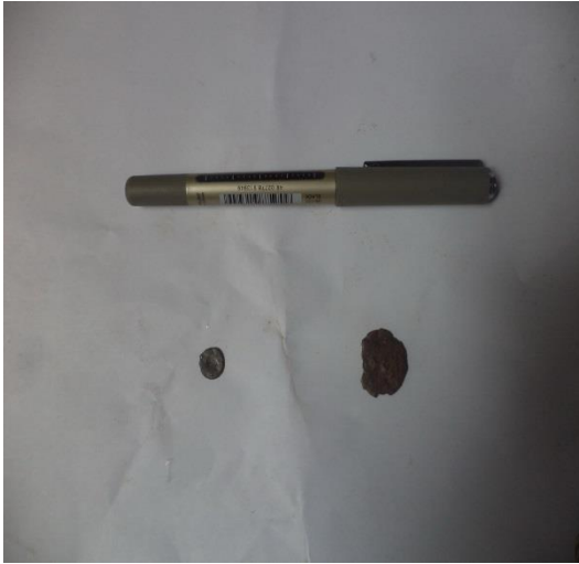
عملتين صغيرتين من البرونز